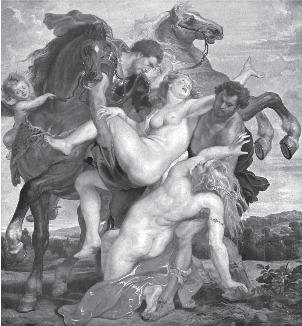
«Ο βιασμός των θυγατέρων του Λεύκιππου» πίνακας του Paul Rubens, 1681

Τα ρυθμιστικά ιδεώδη του φύλου και της συγγένειας των οποίων η εκπλήρωση εξαργυρώνεται με την υπόσχεση της ιδιότητας του πολίτη, αποκλείει από το εθνικό σώμα όσες/ους «φέρουν το στίγμα της βιοπολιτικής ετερότητας» 12 . Γιατί παρόλη την εμπρόθετη υποστήριξη της 'απόκλισης' που συνιστούν, οι Άλλοι του βιοπολιτικού ιδεώδους στερούνται ό,τι δεν επιστρέφουν σε κοινωνική σημασία. Σε αυτό ωστόσο το μελαγχολικά αρνητικό πρόσημο θα αντιπαραθέταμε την εσωτερική εγρήγορση ενός πυρήνα εαυτού που αμύνεται των κανονιστικών προταγμάτων. Η άντληση δύναμης από τα τραυματισμένα όρια της συμβολικής και ηθικής τάξης, ανοίγει ορίζοντες για νέες ταυτίσεις και απολαύσεις.